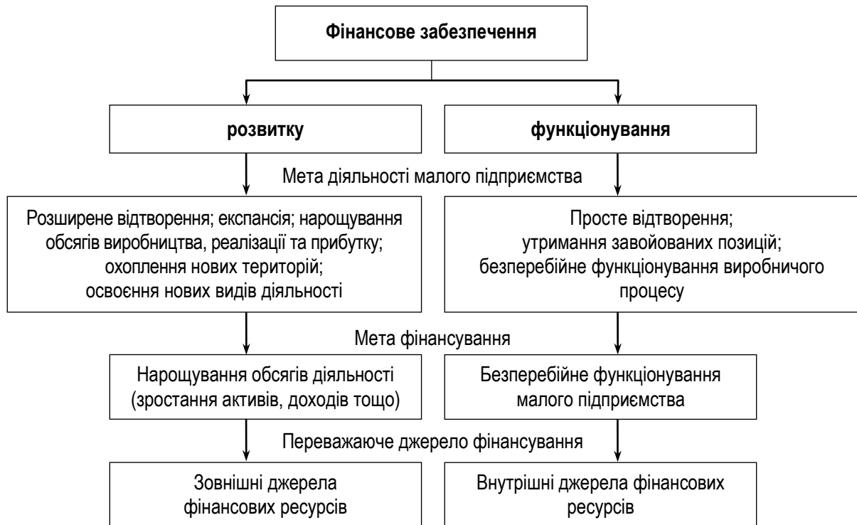
Рис. 1. Особливості фінансового забезпечення малого підприємства залежно від цілей діяльності

Аналіз показав, що всі МП можуть бути поділені на дві великі групи: 1) підприємства, орієнтовані на зростання і розширення; 2) підприємства, що не мають можливостей для росту або не прагнуть цього. Фінансове керівництво даними типами фірм при цьому істотно відрізняється, як і відрізняються їх цілі у сфері фінансування. У першому випадку перед власником (власниками) стоїть стратегічна мета – досягнення самофінансування. Якщо ж підприємець не ставить перед собою мету експансії (як територіальної, так і за видами діяльності), то для нього може виявитися достатньою підтримка самоокупності.